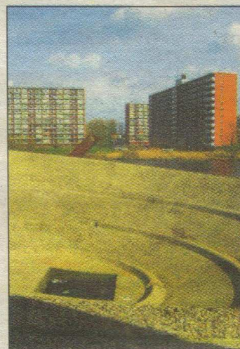
Locatie tussen Het Lage Land en Prinsenland.

Over al deze vragen hoopt de Historische Vereniging Prins Alexander de lezers van de Postiljon de komende tijd te informeren. De Historische Vereniging